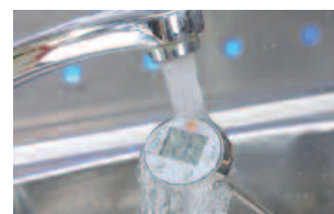
Nettoyage du mini-thermomètre par simple rinçage sous l'eau.