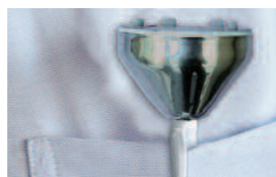
Support/protection. Toujours à portée de main.