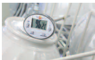
Mesure de température ambiante.