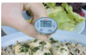
Mesure de la température en alimentaire.